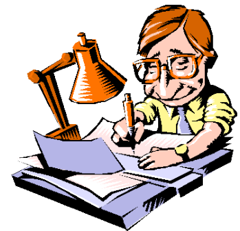
René Nieuwenhoven Redactie

Er is weer veel kopij aangeleverd. Veel leesplezier! Heeft u informatie voor een volgende editie, stuur die dan naar redactie@nv-radboud.nl