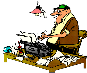
René Nieuwenhoven Redactie

Voor u weer de nieuwsbrief. Veel leesplezier! Heeft u informatie voor een volgende editie, stuur die dan naar redactie@nv-radboud.nl